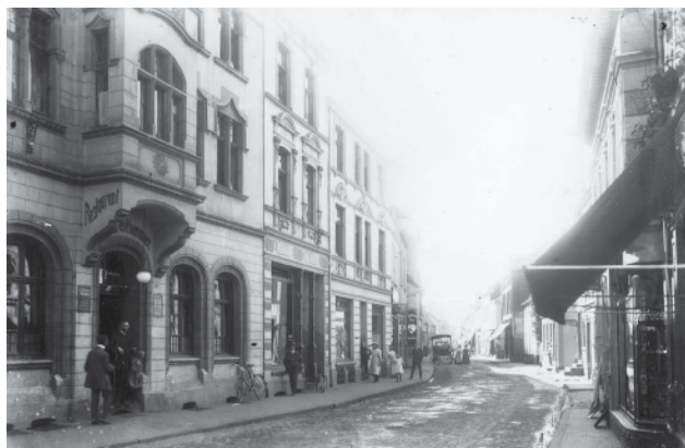
Abb. 2 Zehn Jahre später taucht der Name Dölken gleich doppelt im Dinslakener Adressbuch auf. Und beide Male in der Branche »Bäckereien und Konditoreien«.

Am 15. September 1899, also kurz vor der Jahrtausendwende, geht bei der Dinslakener Polizei, die auch die Funktion eines Gewerbeamts ausübt, ein Antrag ein. Handschriftlich in Sütterlin ( Abb. 1 ):